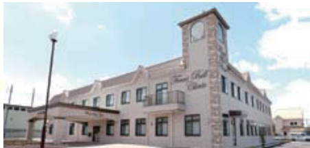
地域の女性のための「かかりつけ医」を目指しているとか。

経験豊富なスタッフが24時間体制でサポートしてくれる『フォレストベルクリニック』が、5月2日、守山区に誕生。婦人科漢方治療や、女性のための鍼灸治療を導入。産科だけでなく、婦人科手術にも幅広く対応してもらえます。また、子宮頸がんや乳がんなど、女性のトータル検診してもらえます。